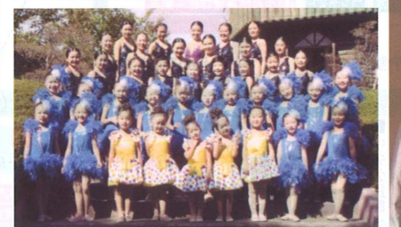
● パトチーム アリエス ●