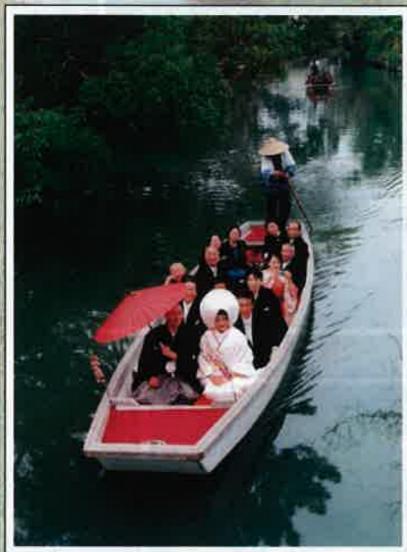
「船出」 柳川の堀割(福岡県柳川市) 福原良一(佐賀県)