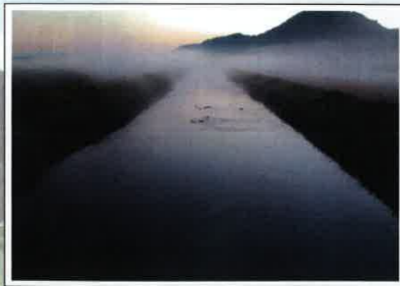
「静かな朝」 岩見用水(兵庫県たつの市) 加藤誠司(兵庫県)