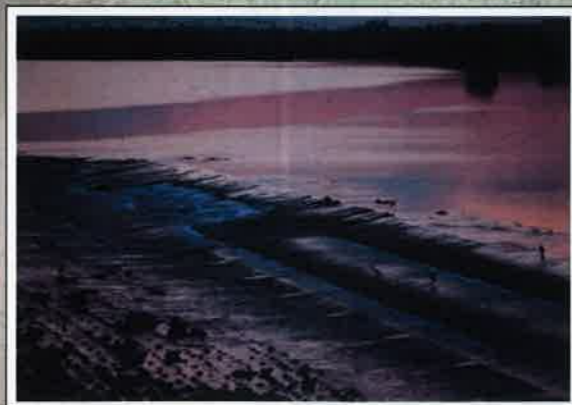
「柿原堰の夕闇」 柿原堰(徳島県阿波市) 三原弘枝(徳島県)