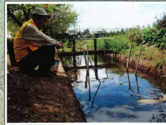
「慈しむ」 大道用水(愛知県安城市) 小澤昌平(愛知県)