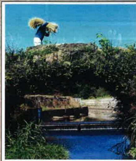
「肅々として」 西ノ谷堰(鹿児島県日置市) 高山博道(鹿児島県)