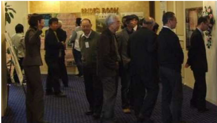
学生のポスターや土木コレクションパネルの見学