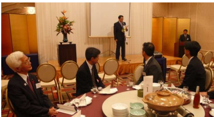
シンポジウム実行委員会新渡戸代表挨拶