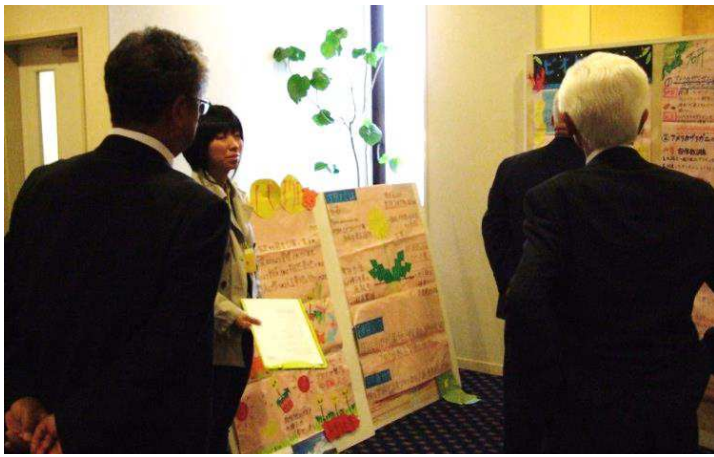
北里大学生と八戸工業大学生によるポスターセッションの様子