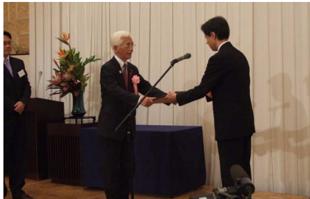
市長への認定証（十和田市街地）授与