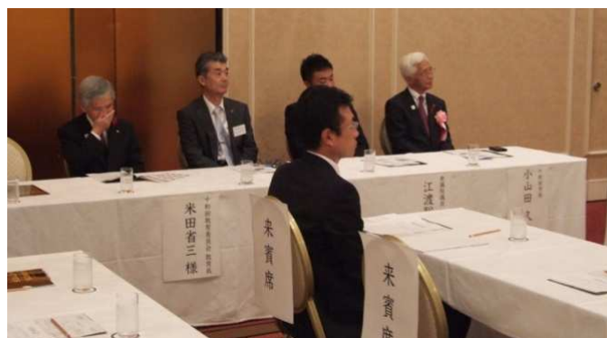
ご来賓のかたがた