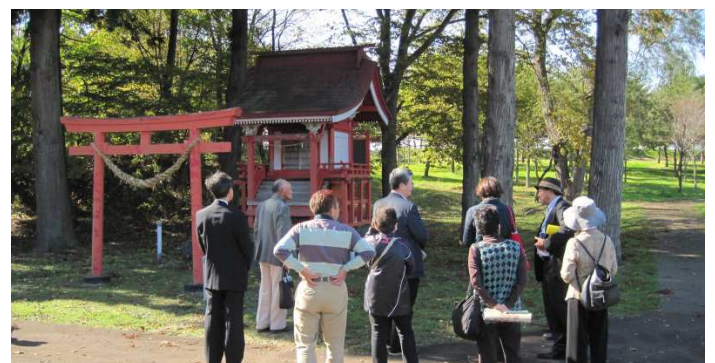
ビオトープ開墾神社前にて