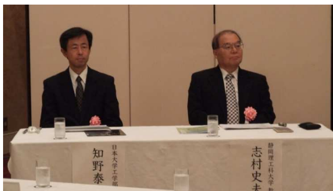
講師：日本大学知野准教授・静岡理工科大学志村教授