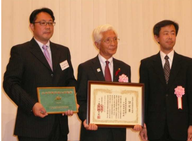
授与者・知野教授とともに記念撮影