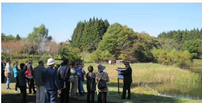
ビオトープため池前にて