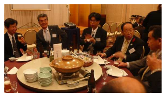
楽しい交流のひとつ

【選奨土木遺産・稲生川現地見学会】平成26年10月26日 9:00~12:00 (参加人数20名)