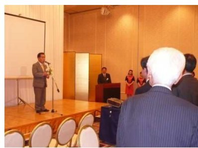
乾杯あいさつ 小川市議会議長