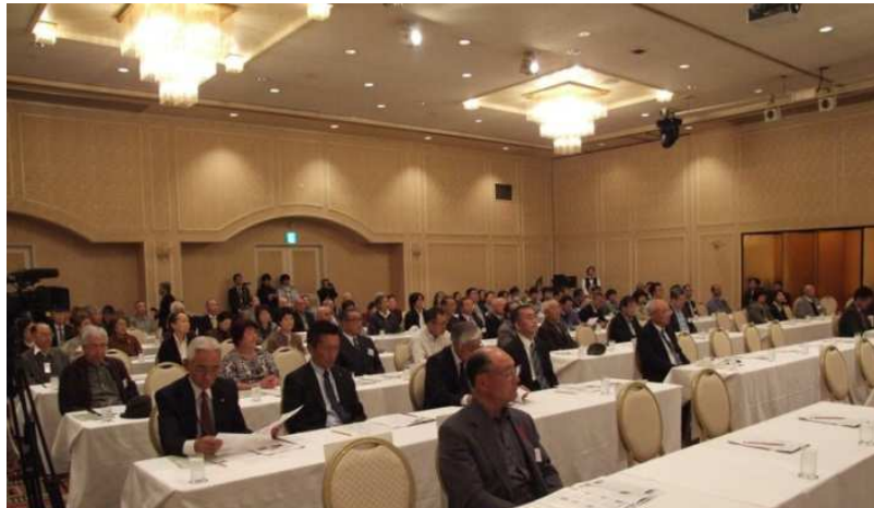
シンポジウム会場の様子