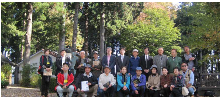
太素塚での記念撮影

【選奨土木遺産・稲生川現地見学会】平成26年10月26日 9:00~12:00 (参加人数20名)