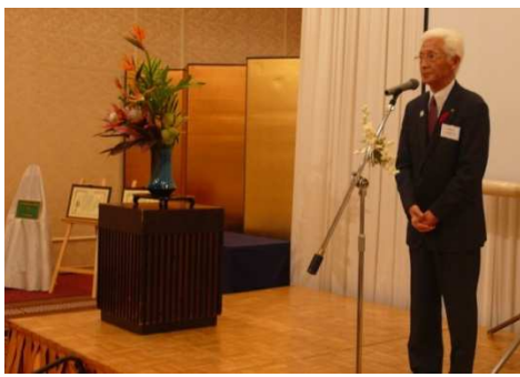
来賓ごあいさつ 十和田市長